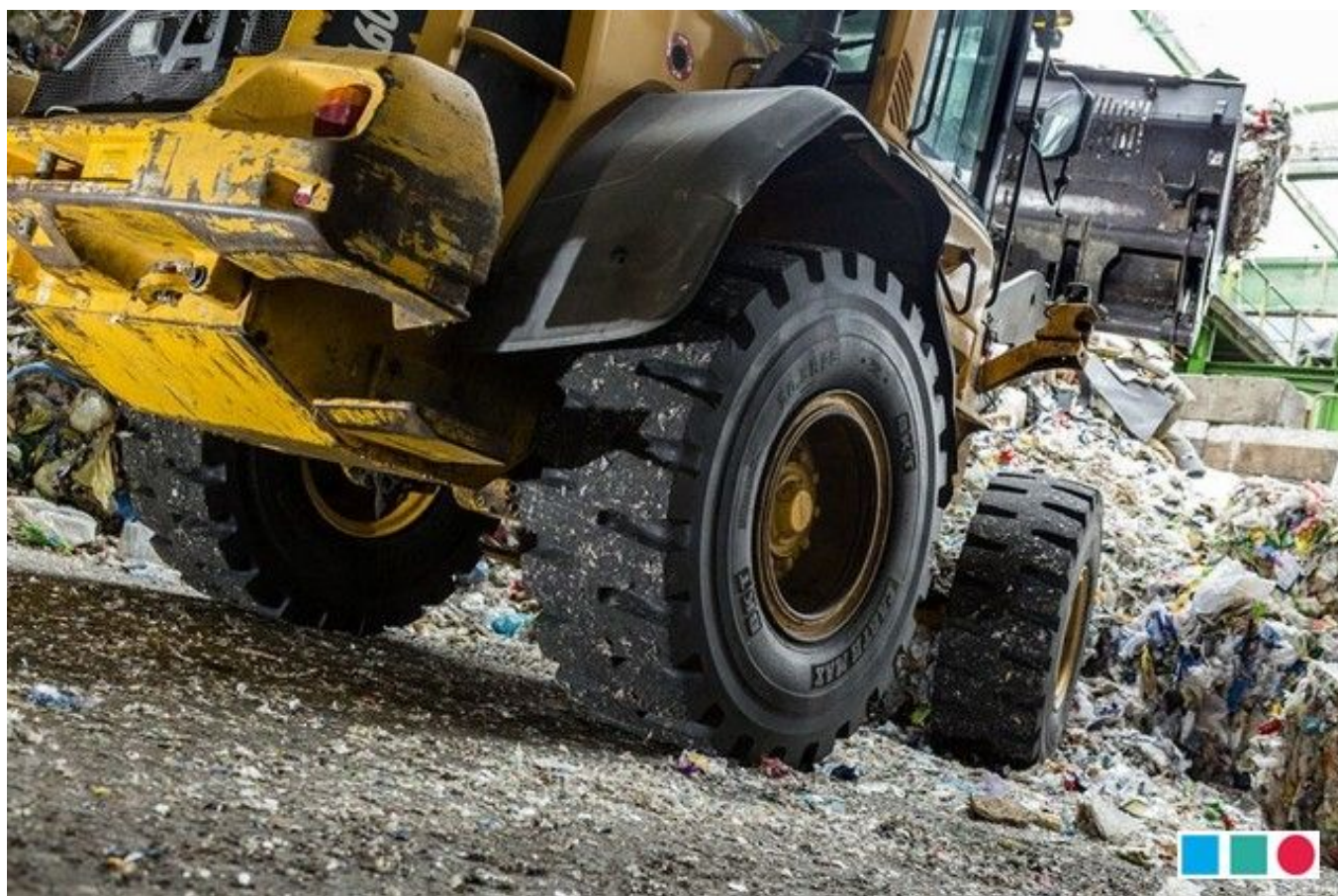
Шины BKT Earthmax SR 53: высокая тяговая способность в сложных условиях.